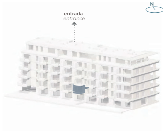
SO - Tardoz SW - Back View