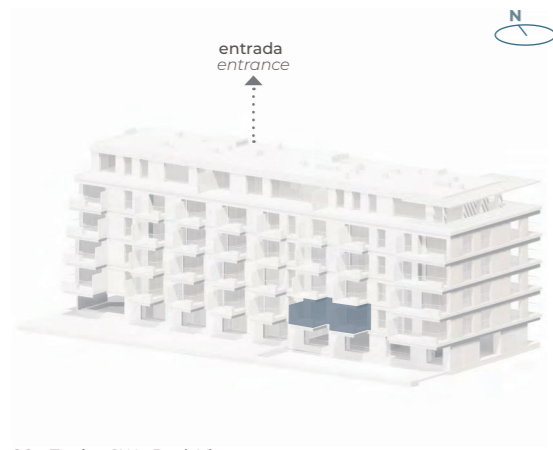
SO - Tardoz SW - Back View